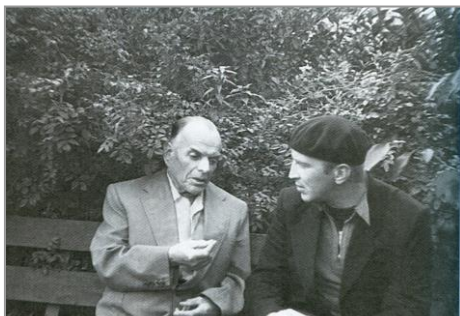
С К.Г. Паустовским 1958 г.

Своих героев он называл «мои тихие герои» и любил не за ударный труд, не за веру в светлое будущее человечества, а за простоту великой истины, которую содержит в себе жизнь всякого мирного, работающего народа; жизнь природная, со святой чередой рождения и смерти, юности и старения, – залог того «вещного знания», что он искал в народе, как и