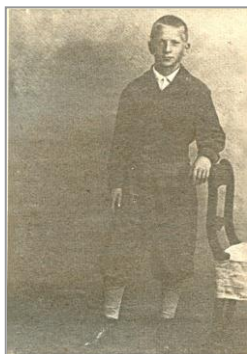
Ю. Казаков 1938 г.

В этом году исполняется 85 лет со дня рождения и 30 лет со дня смерти прекрасного русского писателя Юрия Павловича Казакова.