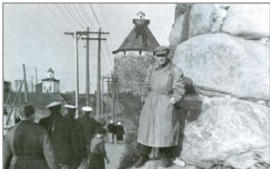
У стен Соловецкого монастыря 1957 г.