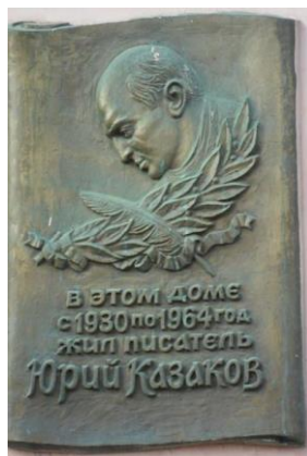
Мемориальная доска писателю Ю. П. Казакову на улице Арбат дом 30

Мемориальная доска писателю Юрию Казакову была торжественно установлена в Москве в 2009 году на стене арбатского дома, где литератор прожил в течение 35 лет.