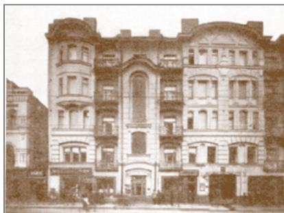
Дом № 30 по улице Арбат, где в 1927-1963 годах жил Ю.П. Казаков

Родился 8 августа в Москве в семье рабочего. С детства мечтая стать музыкантом, будущий писатель окончил музыкальное училище им. Гнесиных по классу контрабаса в 1951 и сразу был принят в состав оркестра Музыкального театра им. К.С.