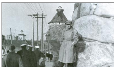
У стен Соловецкого монастыря 1957 г.

В середине прошлого века Казаков совершил чудо: его маленькие рассказы вернули к жизни замороженную, окостеневшую от страха и штампов советскую литературу.