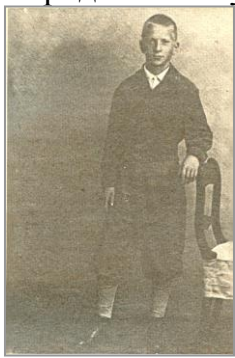
Ю.Казаков 1938 г.

Он был одним из немногих писателей, кто смело продолжал традиции русской классической литературы, потому принадлежал не какому-то определенному временному пласту, и даже не